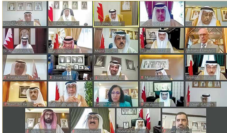
سمو ولي العهد بنسأل الاجتماع الاعتيادي الأسبوعي لمجلس الوزراء

هنا مجلس الوزراء صاحب السمو الملكي الأمير خليفة بن سلمان آل خليفة رئيس الوزراء على سلامة الخصوصات الطبية التي أجريت لسموه والتي تكللت بحمد من الله وبفضله سبحانه وتعالى بالتفريق والنجاح، سالنا المجلس العولي عز وجل بأن يمن على سموه موفقو الصحة وتعام العافية وطول العمر؛ لواصله مسيرة مجلس الوزراء في هذا الوطن الحبيب في ظل العهد الزاهر لعاهل البلاد صاحب الجلالة الملك حمد بن عيسى آل خليفة. الإجراءات الاحترازية مع استمرار تطورات ومستجدات التعامل مع فيروس كورونا (كوفيد 19)، حيث أعرب مجلس الوزراء عن الاعتزاز بنجاح مملكة البحرين في التعامل مع هذه الوباءة على صعيد الإجراءات الوقائية الاستباقية وعلى صعيد تخفيف وطأتها على الاقتصاد الوطني، وكان هدفاً الأسمى صحة المواطن ومعيشتة، وجب المجلس بالتقدير والعرفان الجهود الكبيرة التي بذلها صاحب السمو الملكي ولي العهد نائب