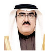
○ د. ياسر الناصر.

وقد ألقى الدكتور ياسر بن عيسى الناصر الأمين العام لمجلس الوزراء عقب جلسة مجلس الوزراء التي عقدت عن بعد بتقنية الاتصال المرئي بالتصريح التالي: